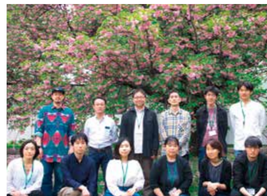
2023年度疾病研究第四部の仲間たち