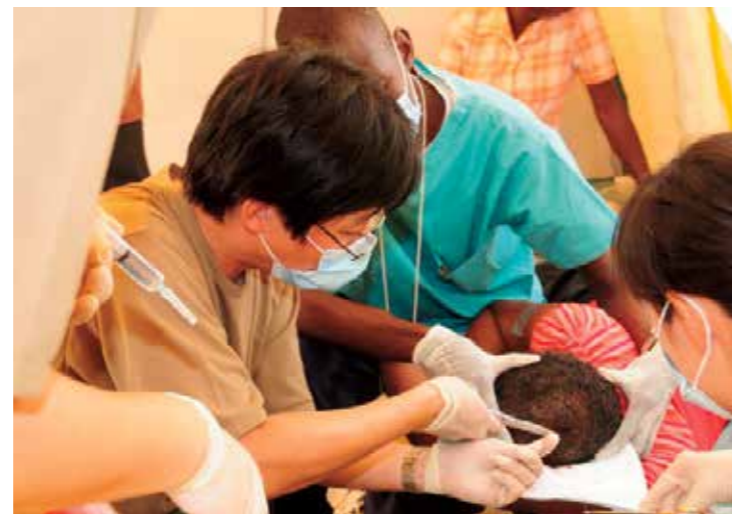
国際緊急医療援助隊活動の様子