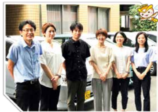
所沢市イメージマスコット トコロん

ています。また、支援の提供だけでなく、所沢市をフィールドとした研究の実施、普及啓発活動、ピアサポーターの育成・協働なども行っています。これらの活動により、自治体におけるメンタルヘルスケアの発展に寄与しているよう取り組んでいます。