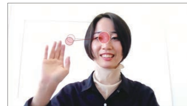
アイトラッカーによる視線の軌跡の計測

認知行動療法センターは、安全で有効な心理療法を開発し、国民の皆さまに届けるための研究・研修を行うとともに、国内外の実践家、研究者、当事者、企業との連携に取り組んでいます。認知行動療法診療部ではコロナ禍で必要とされる非対面での心理社会的介入の技術開発と研究を進めています。