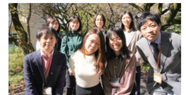
研究部のメンバー